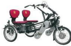
Le fun 2 go