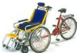
Le vélo fauteuil